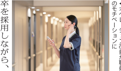
オペレーション改善が職員にモチベーションに