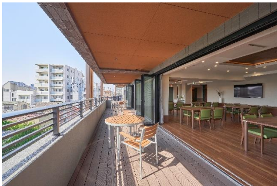
ダイニング(バルコニー)

今までよりも建物全体にゆとり空間を創り出すことで、立地・建物・設備ともに史上最高グレードのアズハイムが誕生しました。