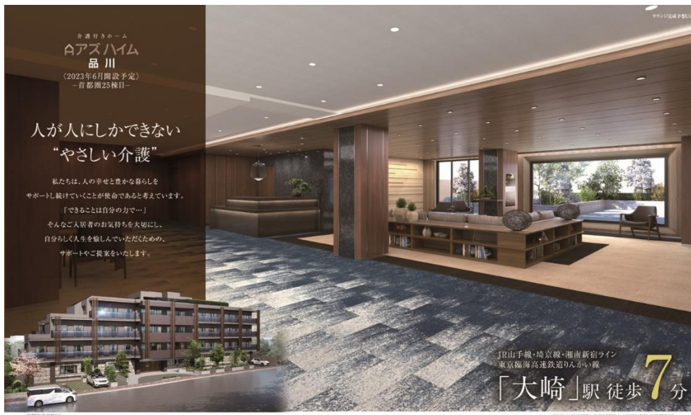
アズハイム品川 ポスター

2023年6月1日、東京都品川区に首都圏 25 棟目の介護付きホーム 「アズハイム品川」が新規オープン