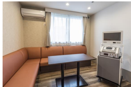
多目的室(アズハイム新松戸デイサービスセンター)

入浴サービスはレクリエーションの一環であるという考えのもと、安心・安全は当然のこととして、ご家庭とは違った優雅なひとときを過ごしていただけるような空間づくりを目指しています。