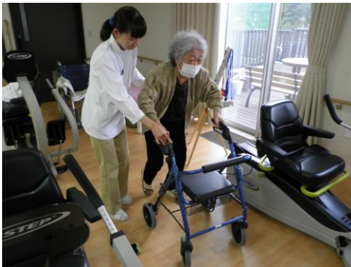
リハビリ専門職による個別訓練の実施

リハビリ専門職である理学療法士等が、その方に合わせた個別プログラムを作成し、目標や楽しみをもって機能訓練に取り組めるよう支援してまいります。マシントレーニングやエアロビ体操、マット体操など運動プログラムの充実を図っております。