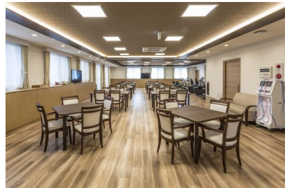
リビングダイニング(アズハイム新松戸サービスセンター)