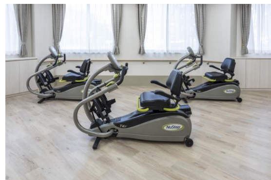
リハビリスペース(アズハイム赤塚デイサービスセンター)