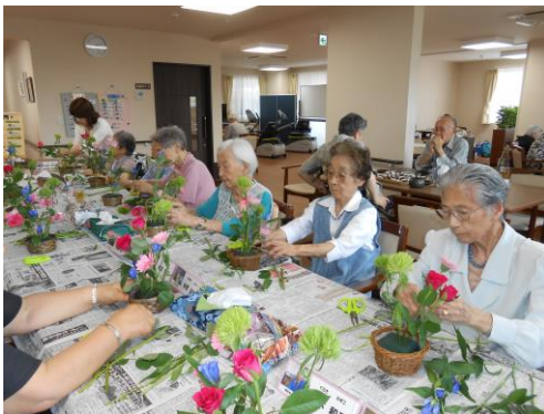
フラワーアレンジメント教室