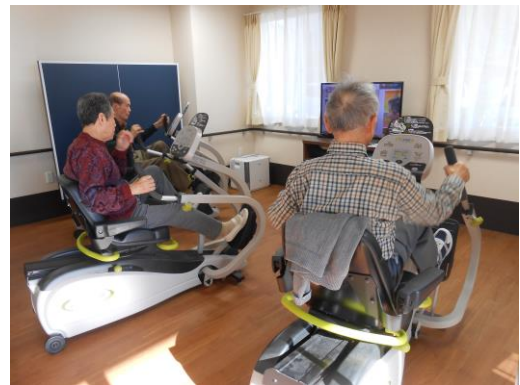
マシントレーニング