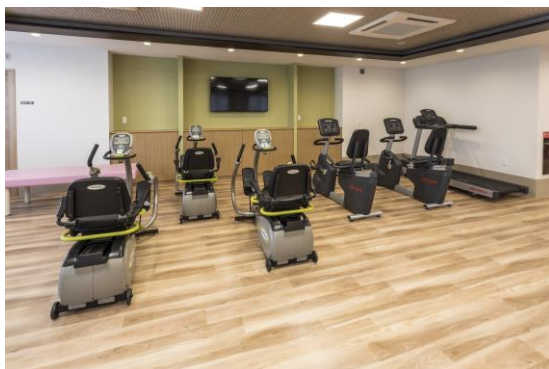
リハビリスペース(アズハイム新松戸デイサービスセンター)