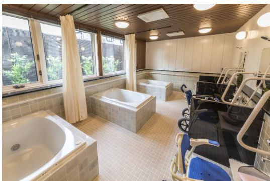
個浴(アズハイム新松戸デイサービスセンター)

敢えて個々の浴槽を採用することで、ご利用者にとってはプライベートも考慮した造りとなりました。利用者様の嗜好に合わせて温度調節も小まめにでき、気兼ねなく、好きな温かさで寛ぎの入浴を楽しんでいただけます。