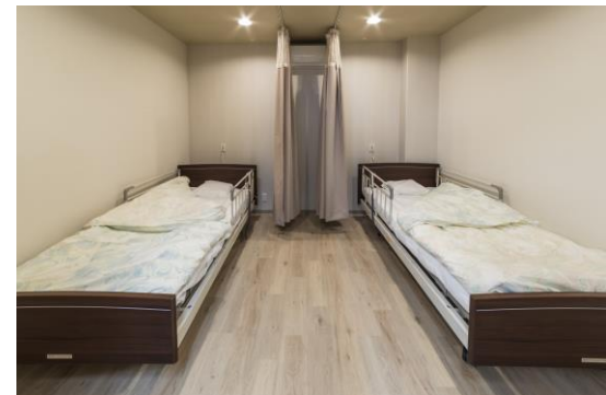
静養室(アズハイム赤塚サービスセンター)

今後も設立以来培った経験を活かし、【質の高いサービス提供】を胸に、ご利用者の方々に安心してご利用いただけるようサービス提供してまいります。アズパートナーズの更なる活躍にご期待ください。