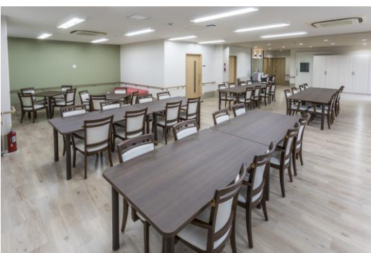
リビングダイニング(アズハイム赤塚サービスセンター)